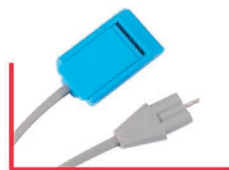
REM Valleylab MI 3.05.VALD.40