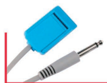
Jack 6,35 standard MI 3.05.BLEU.40