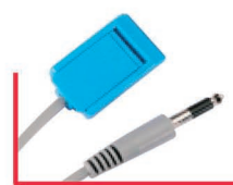
Jack 6,35 Erbe MI 3.05.BLRB.40